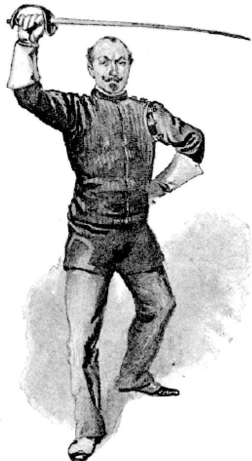
ST. GEORGE'S PARRY.